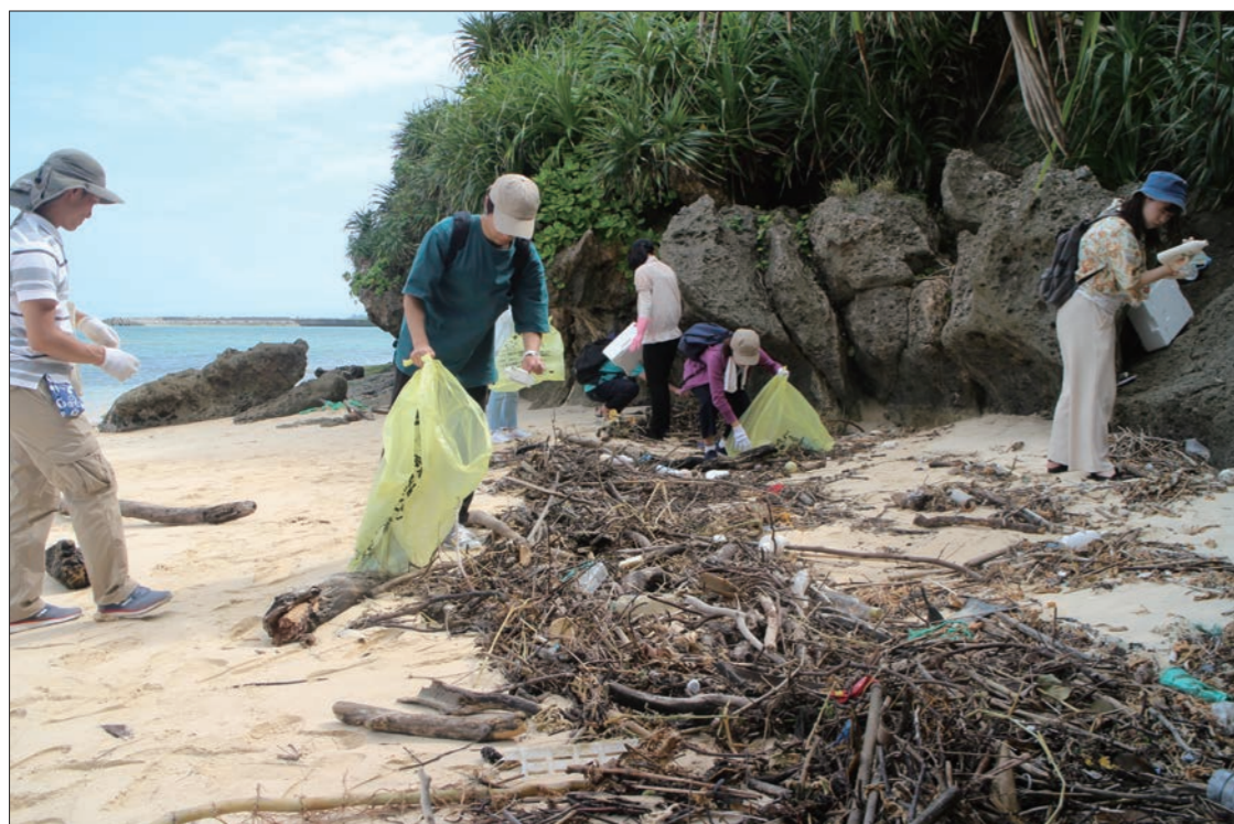
海洋学際教育プログラムの授業で訪れた沖縄本島の海岸でゴミを拾う学生たち