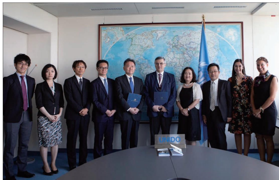
国際連合工業開発機関 (UNIDO) とのインターンシップ協定締結式 (2018年7月)

「海洋学際教育プログラム」は、東京大学の横断型教育プログラム(大学院横断型)として、2009年度に開始された。「学際領域としての海洋学の総合的な発展と、日本の海洋政策の統合化および国際化を担う人材の育成」を目的とし、様々な研究科の大学院生が参加して分野横断的な教育が行われている 1) 。カリキュラムは、新領域創成科学研究科、農学生命科学研究科、工学系研究科、理学系研究科、公共政策学教育部の5部局から出される科目で構成され、所定単位(現在は12単位)を取得し、修了要件を満たした大学院生に対して、教育運営委員会が発行する修了証が交付される。