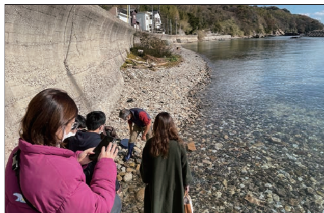
海洋問題演習の調査の一環として瀬戸内海の海岸を訪れた