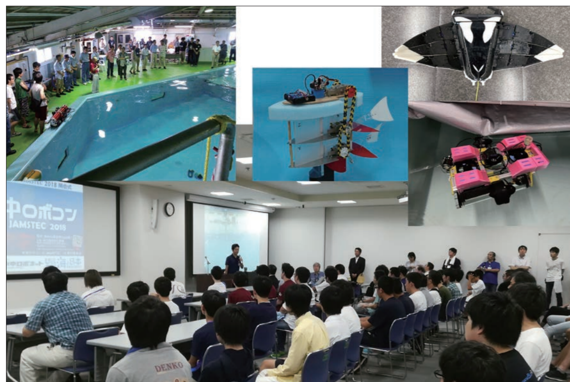
左上:水槽競技の様子 右上:過去に出場したロボットの例 下:2018年の水中ロボコン開会式の様子 演壇に立っているのが著者