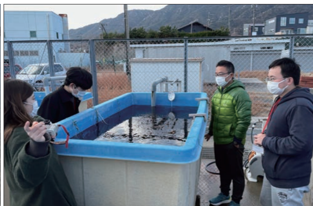
海洋問題演習の調査の一環として訪れた海藻養殖施設を見学する学生たち